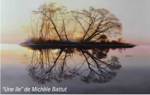
"Une île" de Michèle Battut