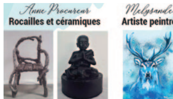
Anne Procureur Rocailles et céramiques

Exposition de 30 tableaux issus de l'édition 2017 du Concours International d'art plastique où les graines d'artistes nous font découvrir leur vision de cette ressource naturelle si précieuse qu'est l'eau en 4 sous thèmes : Comme un poisson dans l'eau, les petits bateaux qui vont sur l'eau, un long fleuve tranquille, eau couleur, eau lumière.