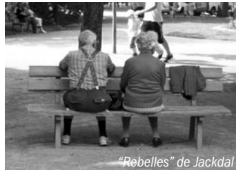
"Rebelles" de Jackdal