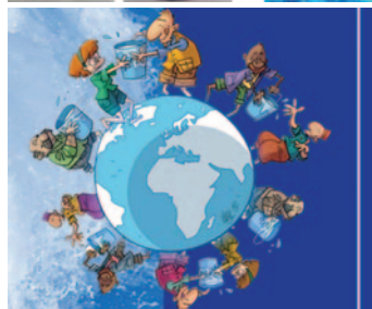
Mélysande Artiste peintre